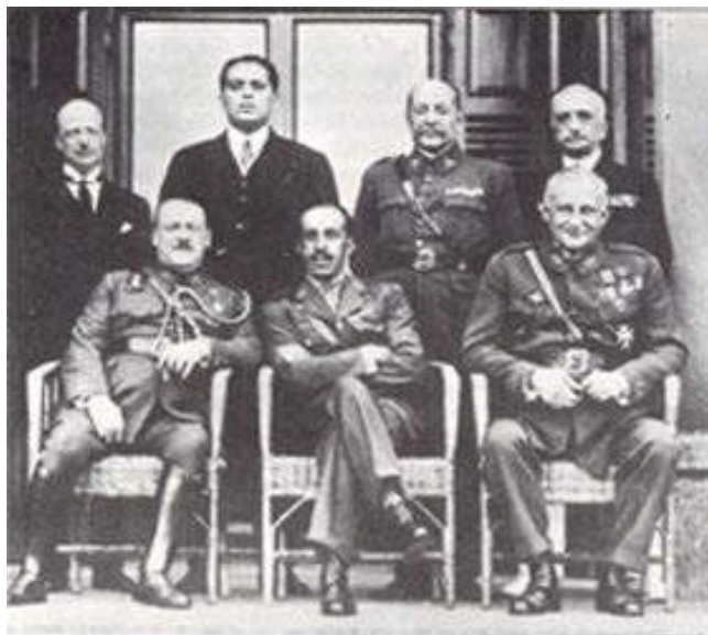
Miguel Primo de Rivera (sentado a la derecha) al frente del directorio civil en 1925 a su lado el rey Alfonso XIII