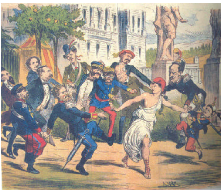
Prim busca a ciegas un régimen. Líderes políticos del Sexenio democrático, según una caricatura de la época.