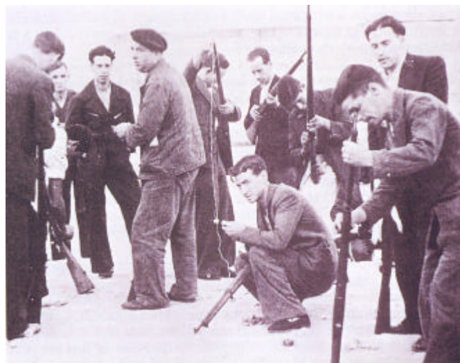
Entrega de fusiles a la población de Madrid por el gobierno de la República, 18 de julio de 1936

Discurso de Pietro Nenni en Madrid, (6 de febrero de 1937)