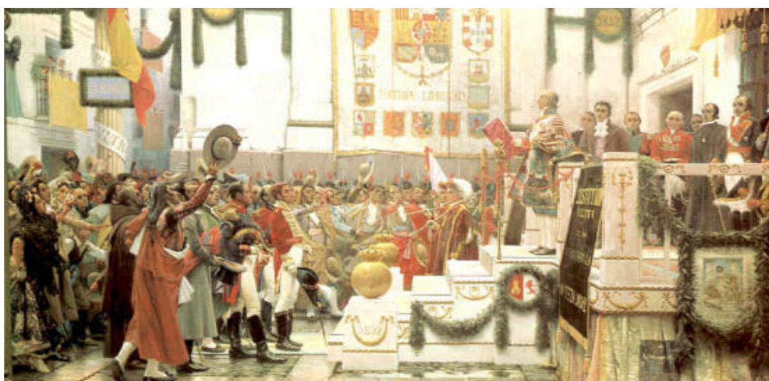
Pintura mural titulada “Constitución de 1812 en Cádiz”, que representa el momento de la promulgación de la Constitución. Obra de Salvador Viniegra. Museo Histórico Municipal de Cádiz, España