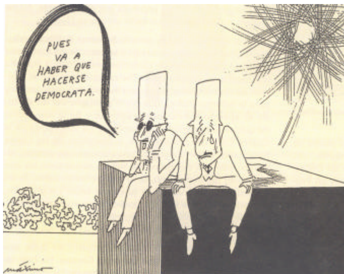
Chiste de Máximo aparecido en El País, febrero de 1976