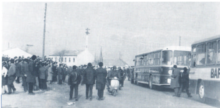
Jornada de protesta en la factoría Barreiros en Madrid, años 60