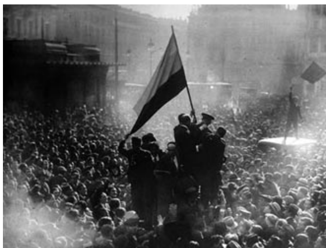
Proclamación de la II República

(Manuel Tuñón de Lara: Tres claves de la Segunda República , Alianza Ed., Madrid, 1985)