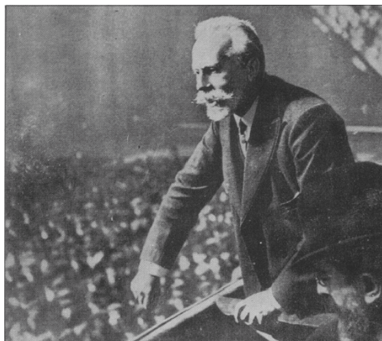
Intervención de Pablo Iglesias en un mitin

Realice una composición sobre El Republicanismo y el movimiento obrero en la Restauración , a partir del análisis del siguiente documento: