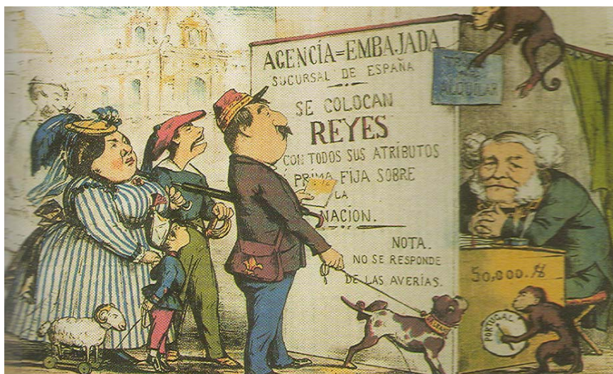
Subasta de reyes

Realice una composición sobre El intento de revolución democrática: el sexenio revolucionario (1868-1874) , a partir del análisis del siguiente documento: