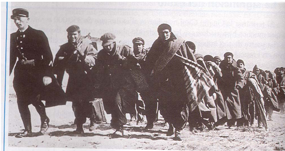
Camino del exilio

Realice una composición sobre La oposición al régimen de Franco , a partir del análisis del siguiente documento: