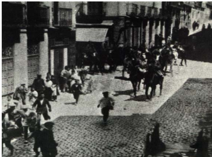
Huelga general de agosto de 1917.

Realice una composición sobre España en el primer tercio del siglo XX: sociedad y economía. La crisis de 1917 , a partir del análisis del siguiente documento: