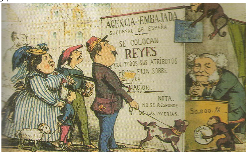
Subasta de reyes

Realice una composición sobre El intento de revolución democrática: el sexenio revolucionario (1868-1874) , a partir del análisis de los siguientes documentos: