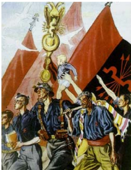
Cartel de Falange