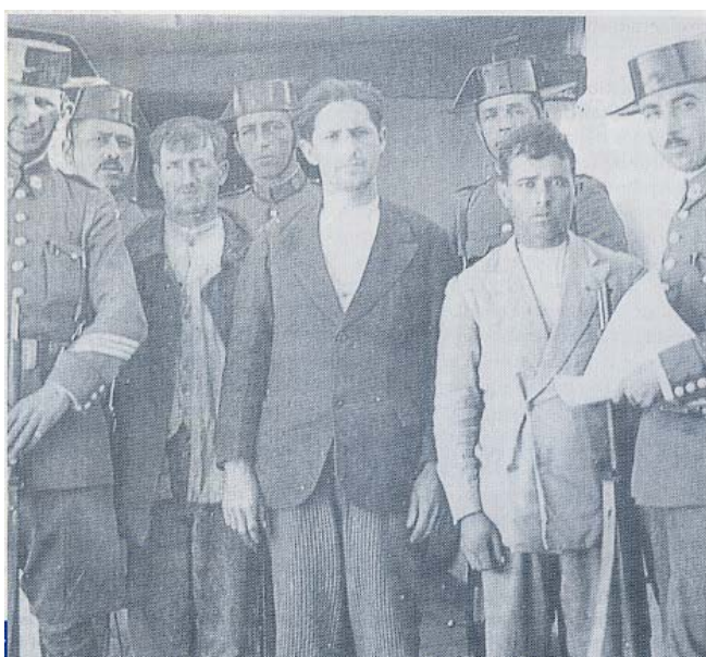
Campesinos detenidos por la Guardia Civil después del levantamiento de Casas Viejas (1933)