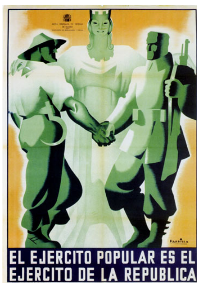
Cartel de la Junta Delegada de Defensa de Madrid (1937)