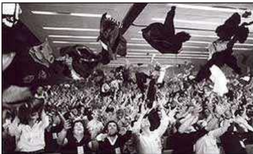
Los comunistas celebran la legalización de su partido en abril de 1977