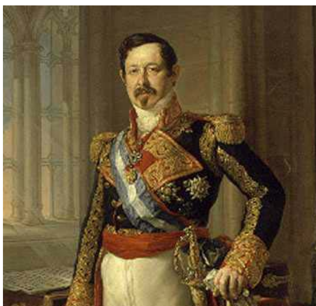
General Ramón María Narváez