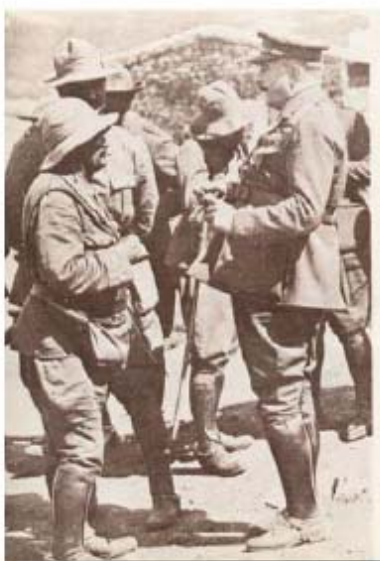
Primo de Rivera visita las tropas españolas en Marruecos.

Manifiesto del General Primo de Rivera, publicado en ABC el 14 de septiembre de 1923