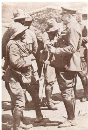
Primo de Rivera visita las tropas españolas en Marruecos.